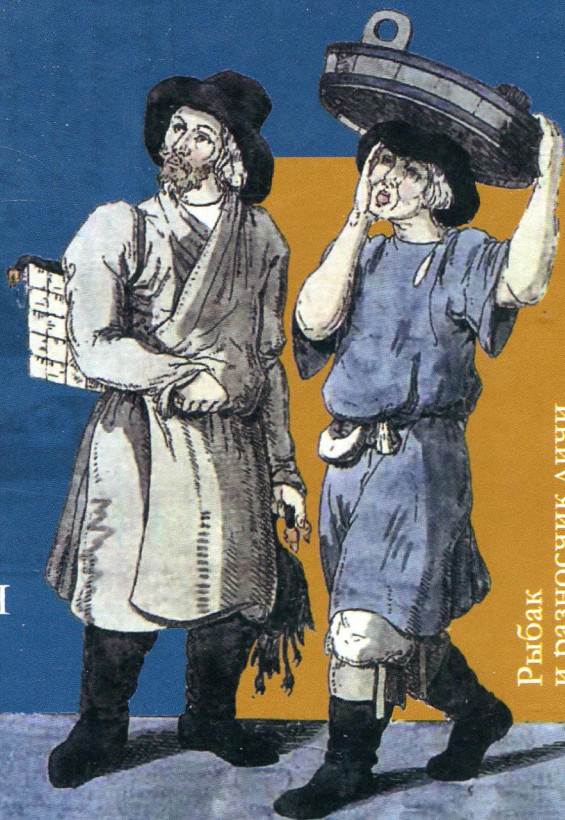
Рыбак и разносчик дичи

Из истории конструирования этничности. Век XIX